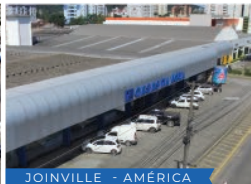
JOINVILLE - AMÉRICA