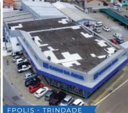
FPOLIS - TRINDADE