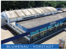
BLUMENAU - VORSTADT