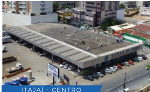
ITAJAÍ - CENTRO