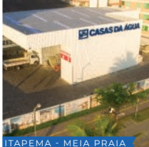
ITAPEMA - MEIA PRAIA