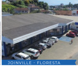
JOINVILLE - FLORESTA