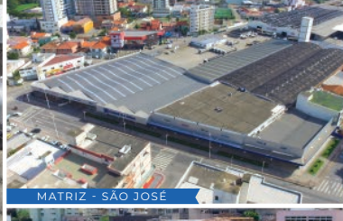
MATRIZ - SÃO JOSÉ