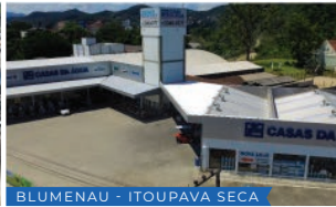
BLUMENAU - ITOUPAVA SECA