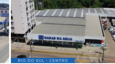
RIO DO SUL - CENTRO