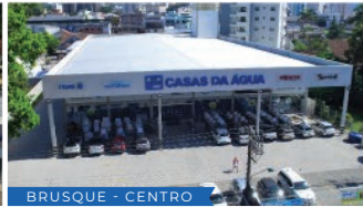
BRUSQUE - CENTRO