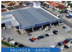
PALHOÇA - ARIRIÚ