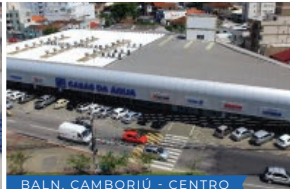
BALN. CAMBORIÚ - CENTRO