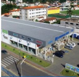
BIGUAÇU - UNIVERSITÁRIO