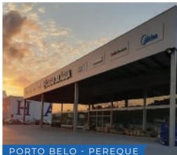
PORTO BELO - PEREQUE