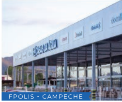
FPOLIS - CAMPECHE