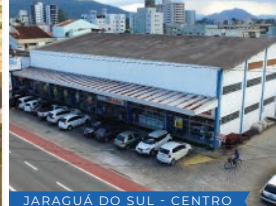
JARAGUÁ DO SUL - CENTRO