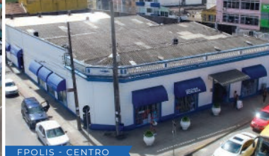
FPOLIS - CENTRO